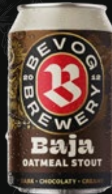
BAJA Oatmeal stout 5,70 €