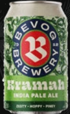
KRAMAH India Pale ale 5,70 €