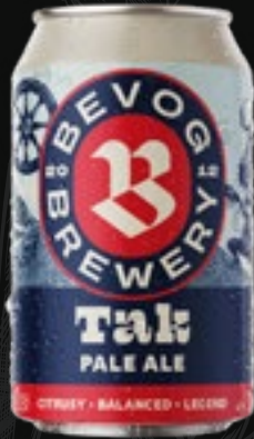
TAK Pale ale 5,70 €