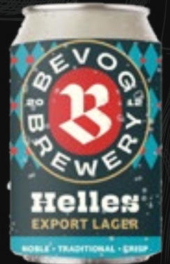
HELLES Lager 5,70 €