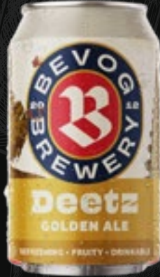
DEETZ Golden ale 5,70 €