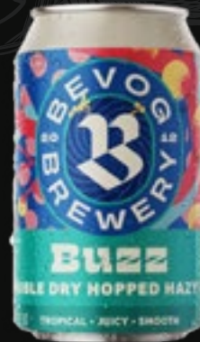
BUZZ Hazy Ipa 5,70 €